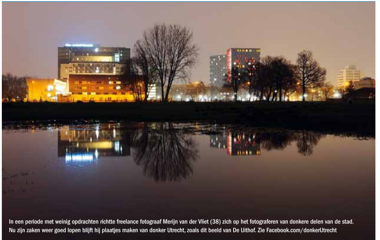
In een periode met weinig opdrachten richtte freelance fotograaf Merijn van der Vliet (38) zich op het fotograferen van donkere delen van de stad. Nu zijn zaken weer goed lopen blijft hij plaatjes maken van donker Utrecht, zoals dit beeld van De Uithof. Zie Facebook.com/donkerUtrecht

Raadpleeg www.cultuurinoost.nl voor culturele evenementen in Oost.