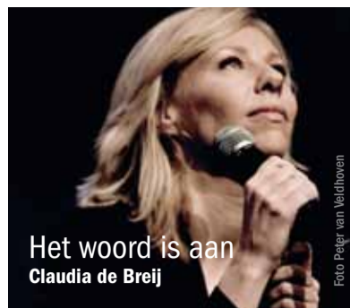
Het woord is aan Claudia de Breij