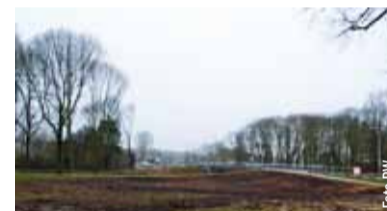
Toekomstig tramstation op kruising Weg tot de Wetenschap en Laan van Maarschalkerweerd.

In totaal worden bijna 700 bomen omgehakt om vrij baan te maken voor de nieuwe tramlijn. Vanaf 2018 rijdt de tram tussen het station en De Uithof. De ooit lommerrijke Laan van Maarschalkerweerd heeft zonder bomen een triest uiterlijk gekregen. Juicht u de komst van de tram en haar tracé toe? Of was een metrolijn beter geweest? Mail ons uw ideeën: redactie@oostkrant.com De precieze route die de tram gaat rijden ziet u in het filmpje op facebook.com/Oostkrant