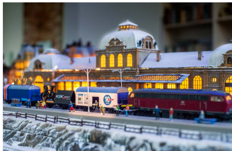
De jubileumwagon van de Oostkrant

Ken jij buurtgenoten of initiatieven die bijdragen aan het (samen)leven in onze wijk? Stuur een mail naar: redactie@oostkrant.com