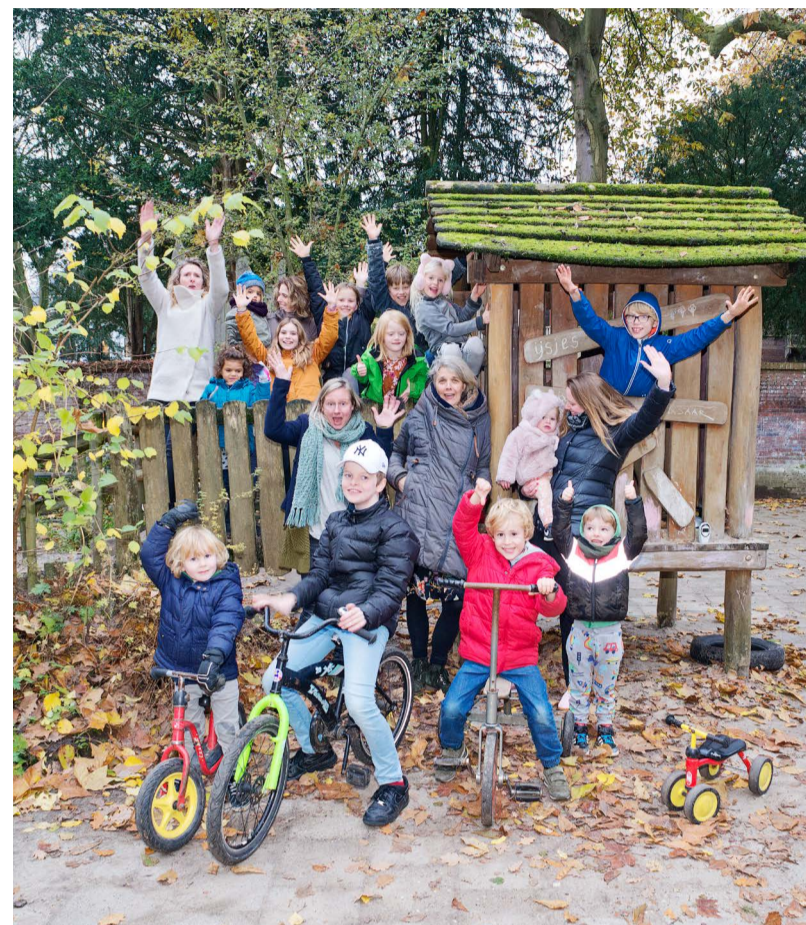
Kinderen en ouders op de speelplaats van kinderopvang Samen Opvoeden

www.sop-creche-utrecht.nl www.kdodevilla.nl www.kinderopvangdoorouders.nl