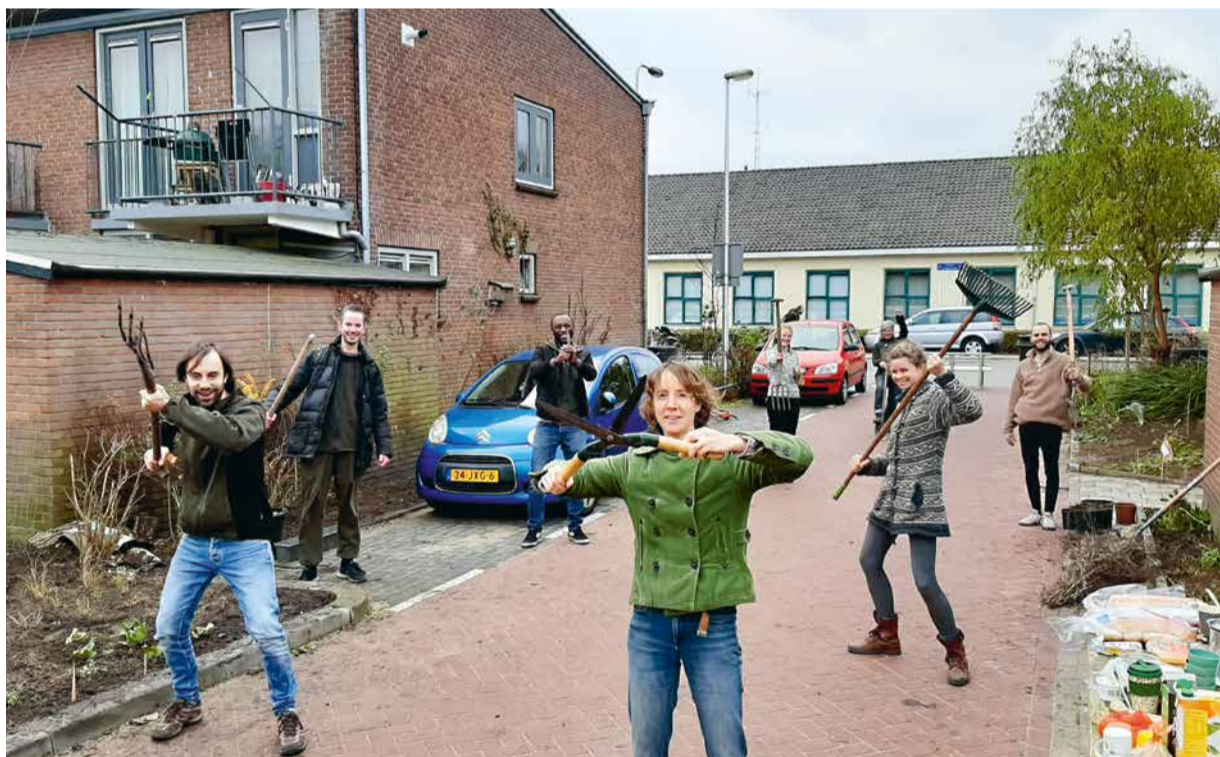
Bewoners in actie om de Fransestraat groener en leefbaarder te maken