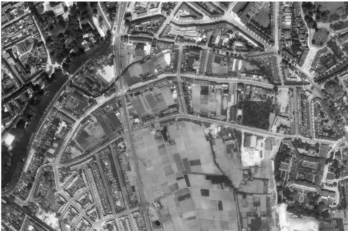
Minstroomgebied in 1955