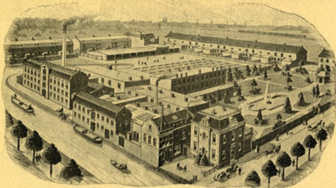
^ Een prent uit 1913 met een overzicht van de fabrieksgebouwen van leerlooierij Wessels. Links is de Minstroom te zien.