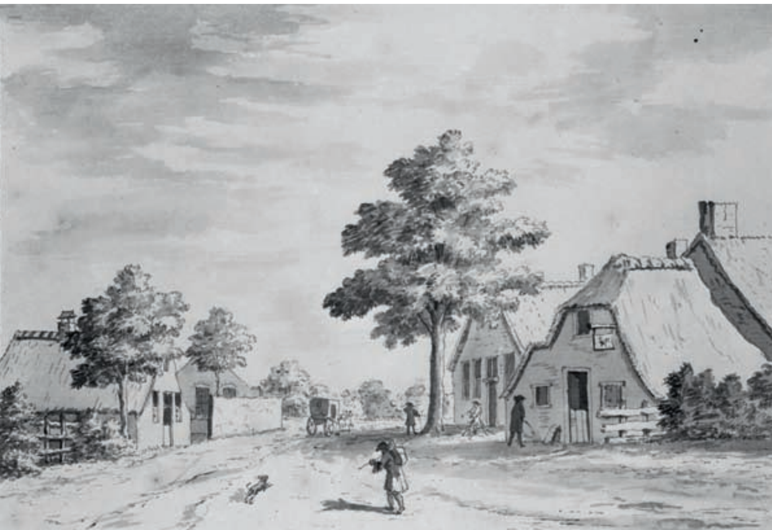
^ L.P. Serrurier tekende de landelijke sfeer in Absteede omstreeks 1729.