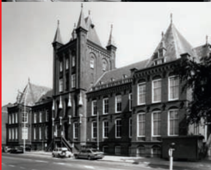
^ ^ De Openbare Lagere School Abstede aan de Abstederdijk omstreeks 1988.