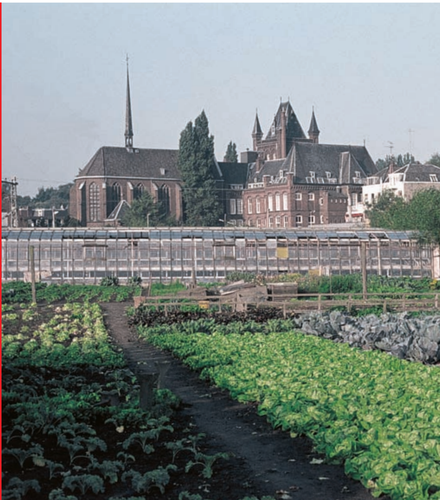
^ Een gezicht op de kassen van een kwekerij in het Minstroomgebied omstreeks 1975. Op de achtergrond is het Hiëronymushuis te zien.