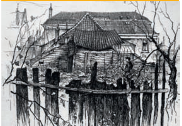
√ De bijgebouwen en een gedeelte van de achtergevel van de boerderij Abstederdijk 188/190, getekend door H. van Dokkum in 1948.

Abstederdijk 188/190 is een van oorsprong zestiende-eeuwse boerderij en bestaat uit een vroeg-negentiende-eeuws woonhuis, genaamd huis de Bras, en een veel ouder schuurgedeelte, ook bekend als het Kerkenhuis, aan de achterkant. In deze schuur was vanaf ongeveer 1600 tot 1715 de schuilkerk De statie onder het kruis gevestigd. Deze kerk is de voorloper van de Martinuskerk aan de Oudegracht, die in 1901 werd geopend. In 1978 werd de schuur afgebroken en vijf jaar later, in 1983, weer herbouwd in oude vorm. De gehele boerderij is in de achttiende en negentiende eeuw verschillende keren verbouwd. Het woonhuisgedeelte is in 1811 vernieuwd en later in de negentiende eeuw uitgebreid tot een dubbel woonhuis. Aan de linkervoorzijde van, dat momenteel bepleisterde voorhuis, bevindt zich een onderkelderde opkamer en aan de rechtervoorzijde zijn twee extra zijkamers. De voormalige boerderij is in 1992 aangewezen als rijksmonument en is tegenwoordig verdeeld in vier verschillende woningen.