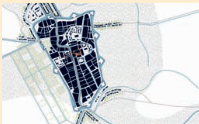
^ In 1650 is de huidige loop van de Minstream (rechts) langs de Abstederdijk al duidelijk te volgen.