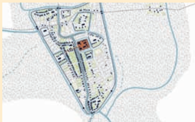
^ Omstreeks 1200 is de loop van de Minstream (rechts) al zichtbaar.