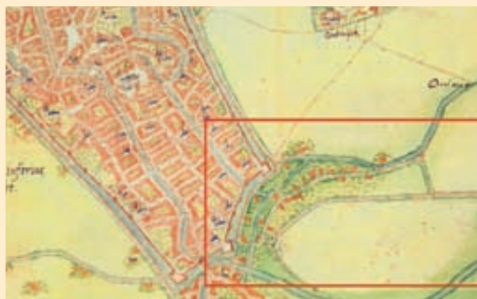
^ Op de oudst bekende kaart van Utrecht, getekend door Jacob van Deventer in 1569-'70, is te zien dat de Minstream nog een aftakking had langs de Zonstraat.

zou er met de stadsvernieuwing opnieuw veel veranderen in het Minstreamgebied. Hoveniersgrond werd door de gemeente opgekocht en bebouwd en een groot aantal arbeiderswoningen werd gesloopt en vervangen door nieuwbouw. Hierdoor verdwenen de laatste hoveniers en veranderde het gebied definitief in een woonwijk. Maar dan wel een bijzondere woonwijk met een bijzondere geschiedenis.