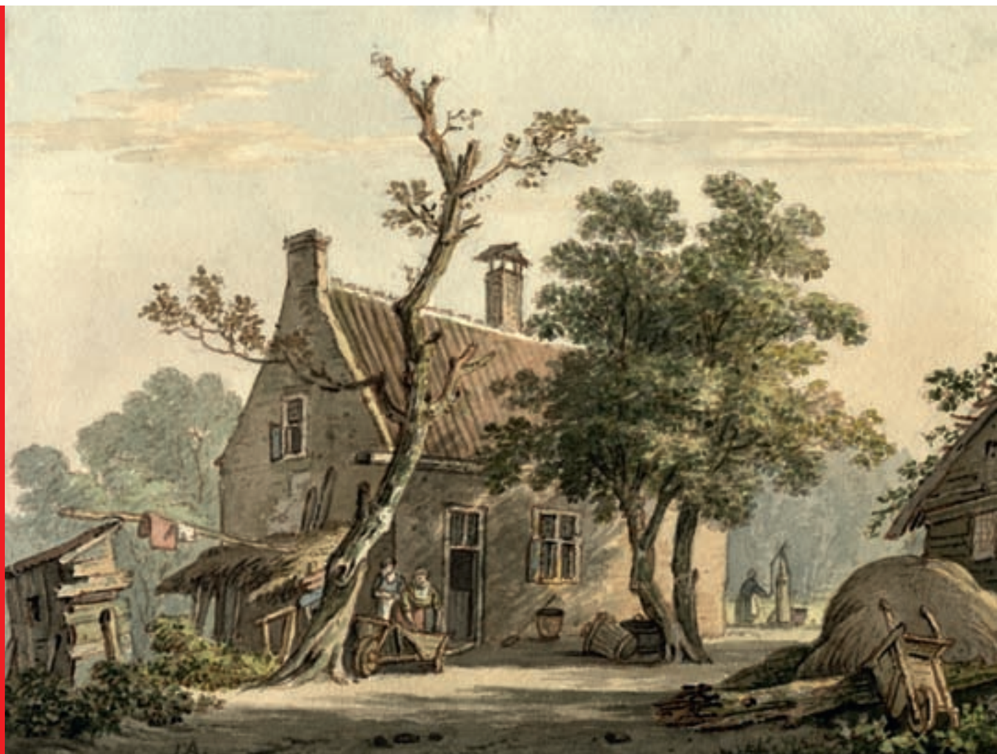
^ Een boerderij in Abstede in 1829.