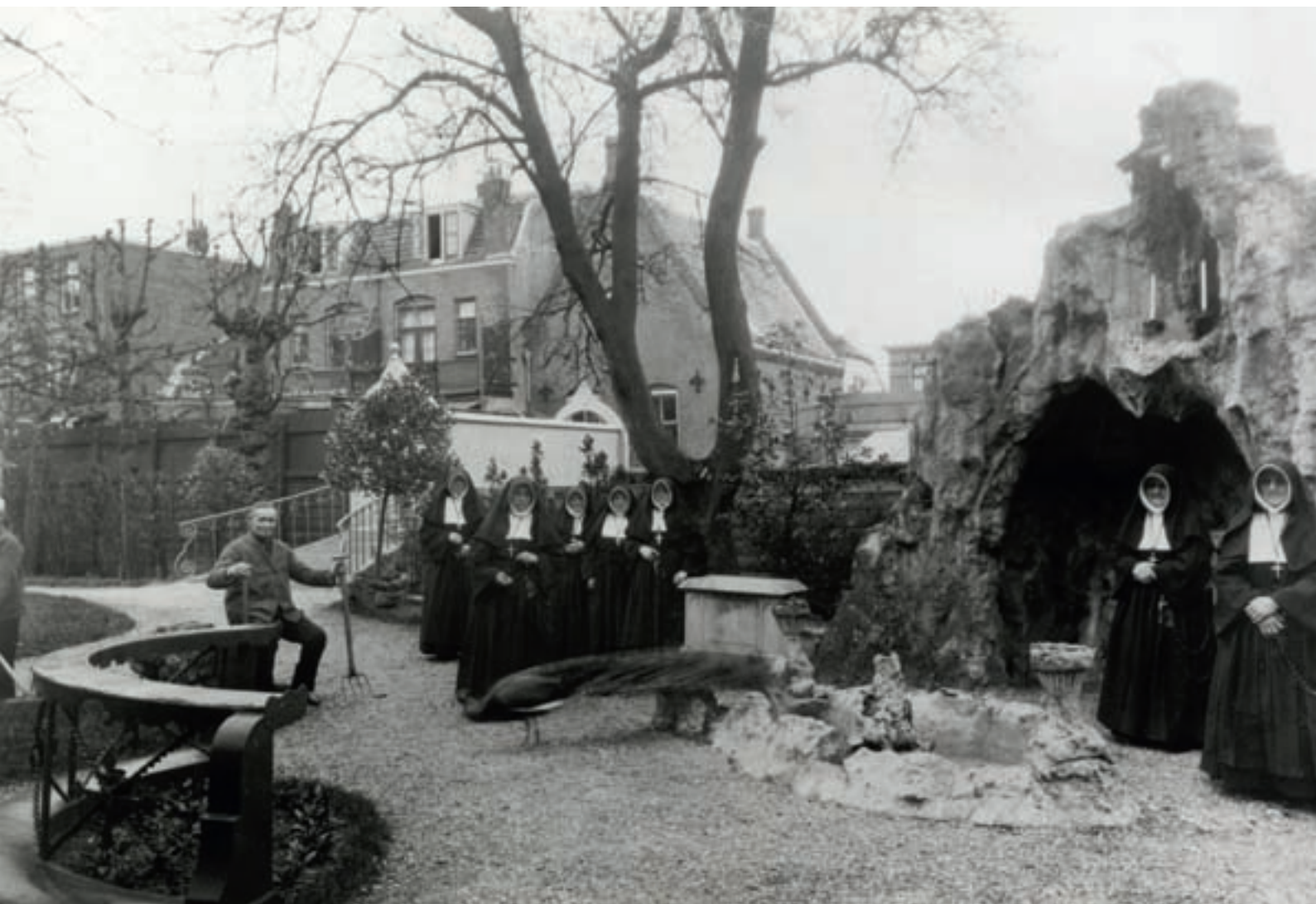
^ De achtertuin van het Hiëronymushuis omstreeks 1910. Op de achtergrond zijn de brug over de Minstream en achtergevels van een aantal woningen aan de Abstederdijk te zien.