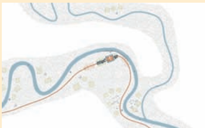
^ De waarschijnlijke loop van de rivieren in Utrecht rond het jaar 200 na Chr., met links de Rijn en rechts de Vecht.