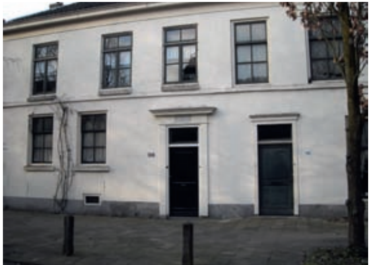
^ Abstederdijk 188/190.

Vanaf de middeleeuwen tot ver in de negentiende eeuw stonden er verspreid over de Abstederdijk, de Notenbomenlaan en de Zonstraat alleen boerderijen en hovenierswoningen. Daarvan zijn er nog enkele bewaard gebleven, die tegenwoordig meestal zijn beschermd als rijks- of gemeentelijk monument. Een hovenierswoning bestond in het algemeen uit een begane grond met een kap en was veelal onderkelderd. Op het achtererf stond meestal een schuur voor de opslag van groenten.