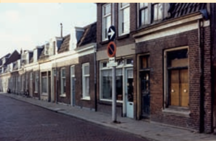
^ De Notenbomenlaan in 1968 met enkele vervallen woningen.

stukken grond en woningen aan, die op voorlopige basis aan de Stichting Studentenhuisvesting verhuurd werden. Door de onzekerheid over de toekomst van het gebied trokken veel gezinnen weg, waardoor ook de middenstand en veel winkels verdwenen. Omdat de woningen toch gesloopt zouden gaan worden, werd weinig aan onderhoud gedaan, waardoor de kwaliteit van het gebied sterk achteruit ging. Veel oude bewoners, waaronder de nog overgebleven hoveniers, verhuisden naar elders. Een van de laatste hoveniers die vertrok was A.J. Emmelot, die een kwekerij had aan de Minkade. Deze locatie moest in 1976 vrijgemaakt worden voor de plannen van de gemeente. Het bedrijf werd verplaatst naar de Gageldijk waar het zich heeft ontwikkeld als tuincentrum.