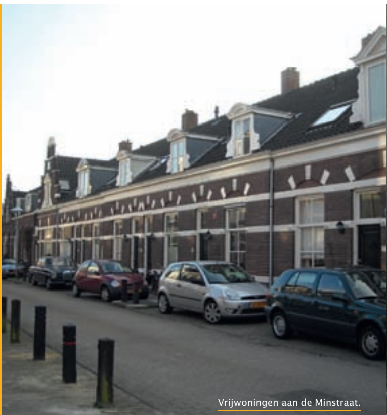
Vrijwoningen aan de Minstraat.